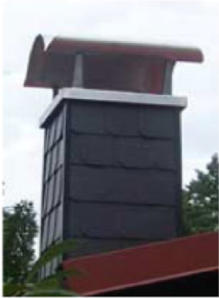
Ist Maße des Schornstein's: